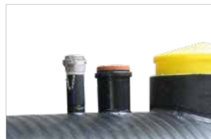
Colonne de vidange, jauge de niveau