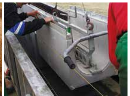
Brussels Airport † Afvoergoten in vezelversterkt beton FASERFIX Super 500