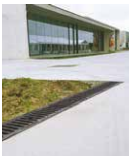
† Brandweerkazerne Deerlijk Afvoergoten in vezelversterkt beton FASERFIX® KS

Innovatieve oplossingen voor een snelle en efficiënte afvoer van oppervlaktewater