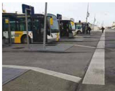
† Stationsomgeving Oostende Spleetgeulen in PP RECYFIX® Hicap®