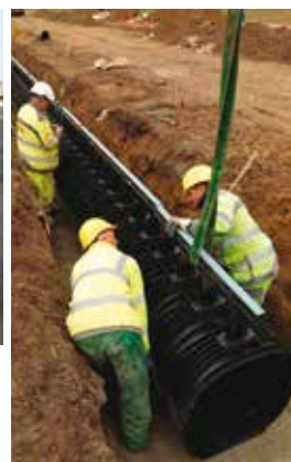
† Militaire basis Bevekom Afvoergoten in PP RECYFIX® HICAP® - 130 lm.