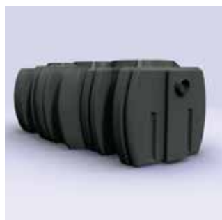
Vet-, zetmeel- en olieafschers EN1825 & EN 858-1 ▲