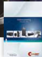
Catalogus op aanvraag beschikbaar